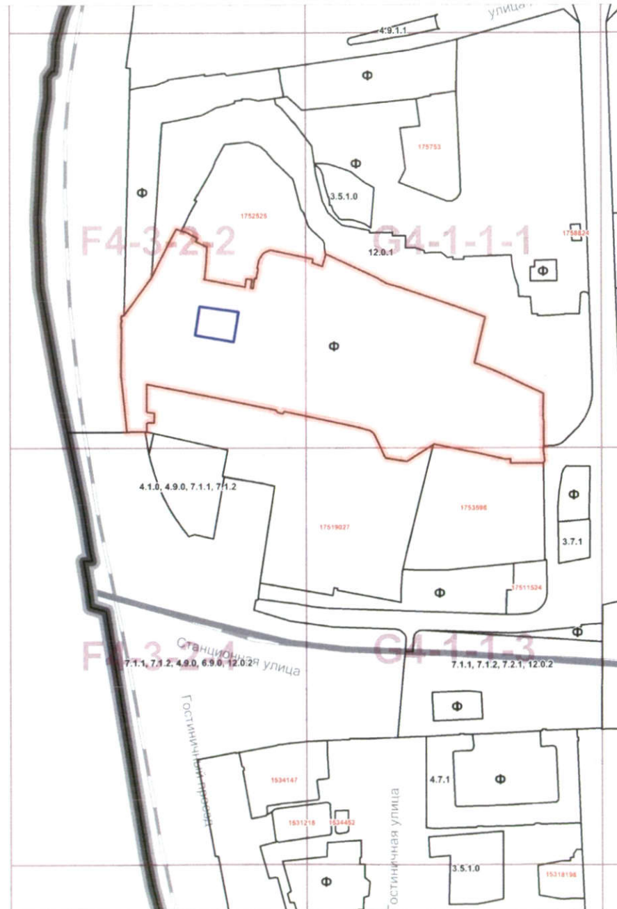
Схема границ подготовки проекта внесения изменений в правила землепользования и застройки города Москвы в отношении территории по адресу: Нововладыкинский проезд, д. 8 (кад. № 77:02:0007003:33), СВАО